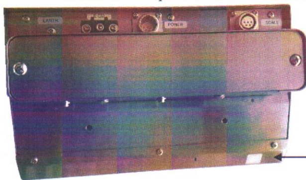
Схема пломбировки весов от несанкционированного доступа приведена на рисунке 2.

Место пломбировки с помощью разрушаемой наклейки (переключатель юстировки)