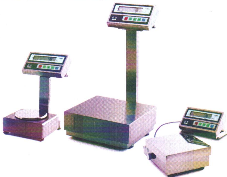
Рисунок 1 – Общий вид весов неавтоматического действия GZII, GZH.

Весы снабжены следующими устройствами и функциями (в скобках указаны соответствующие пункты ГОСТ OIML R 76-1–2011):